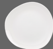
ORGANIC ROUND PLATE WH DG81 21cm 8¼" CTN QTY 12