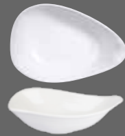
ORGANIC OVAL BOWL WH DB81 21.3cm 8½" 55cl 19.4oz CTN QTY 12