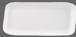
ORGANIC OBLONG PLATE WH DR141 37cm x 17.5cm 13¼" x 6½" CTN QTY 12