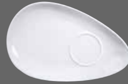
ORGANIC SNACK PLATE WH DS111 28.5cm 11¼" CTN QTY 12 GF

* Fits with small Discover bowls WH DB5 1 Fits with Bit on the Side Ripple Bowls and Cups WH/BCBR/BCBL/BCGR SBRP1 WH/BCBR/BCBL/BCBK/BCGR RP101 WH/BCBR/BCBL RP6 1 WH/BCBR/BCBL/BCGR RPCM 1