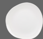
ORGANIC ROUND PLATE WH DG71 18.6cm 7¼" CTN QTY 12