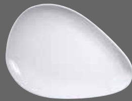
ORGANIC OVAL PLATE WH DI111 29.2cm 11½" CTN QTY 12 GF