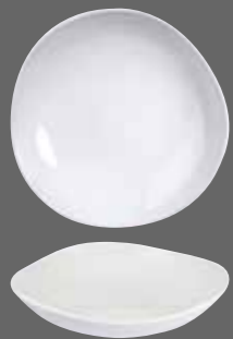
ORGANIC ROUND BOWL WH DGB11 25.3cm 9¾" 110cl 38oz CTN QTY 12