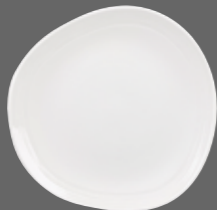
ORGANIC ROUND PLATE WH DG101 26.4cm 10½" CTN QTY 12