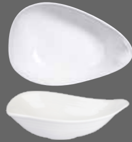
ORGANIC OVAL BOWL WH DB111 28.5cm 11½" 110cl 38.7oz CTN QTY 12

* Fits with small Discover bowls WH DB5 1 Fits with Bit on the Side Ripple Bowls and Cups WH/BCBR/BCBL/BCGR SBRP1 WH/BCBR/BCBL/BCBK/BCGR RP101 WH/BCBR/BCBL RP6 1 WH/BCBR/BCBL/BCGR RPCM 1