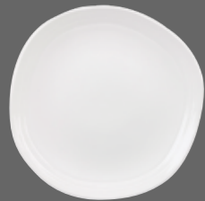
ORGANIC ROUND PLATE WH DG111 28.6cm 11¼" CTN QTY 12