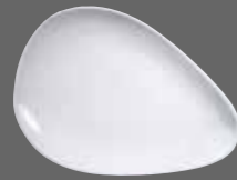
ORGANIC OVAL PLATE WH DI101 27.3cm 10" CTN QTY 12 GF